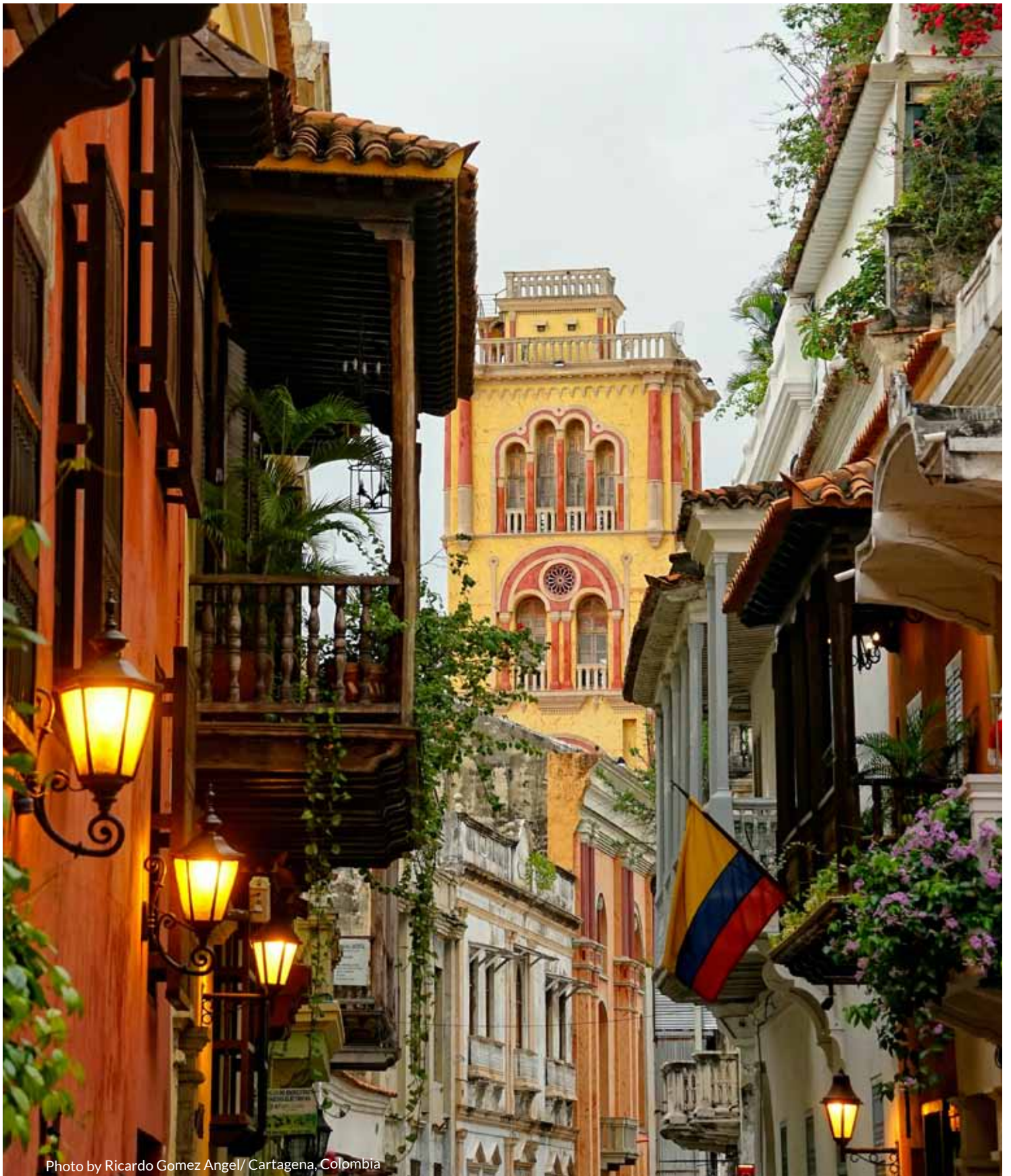
Cartagena, Colombia