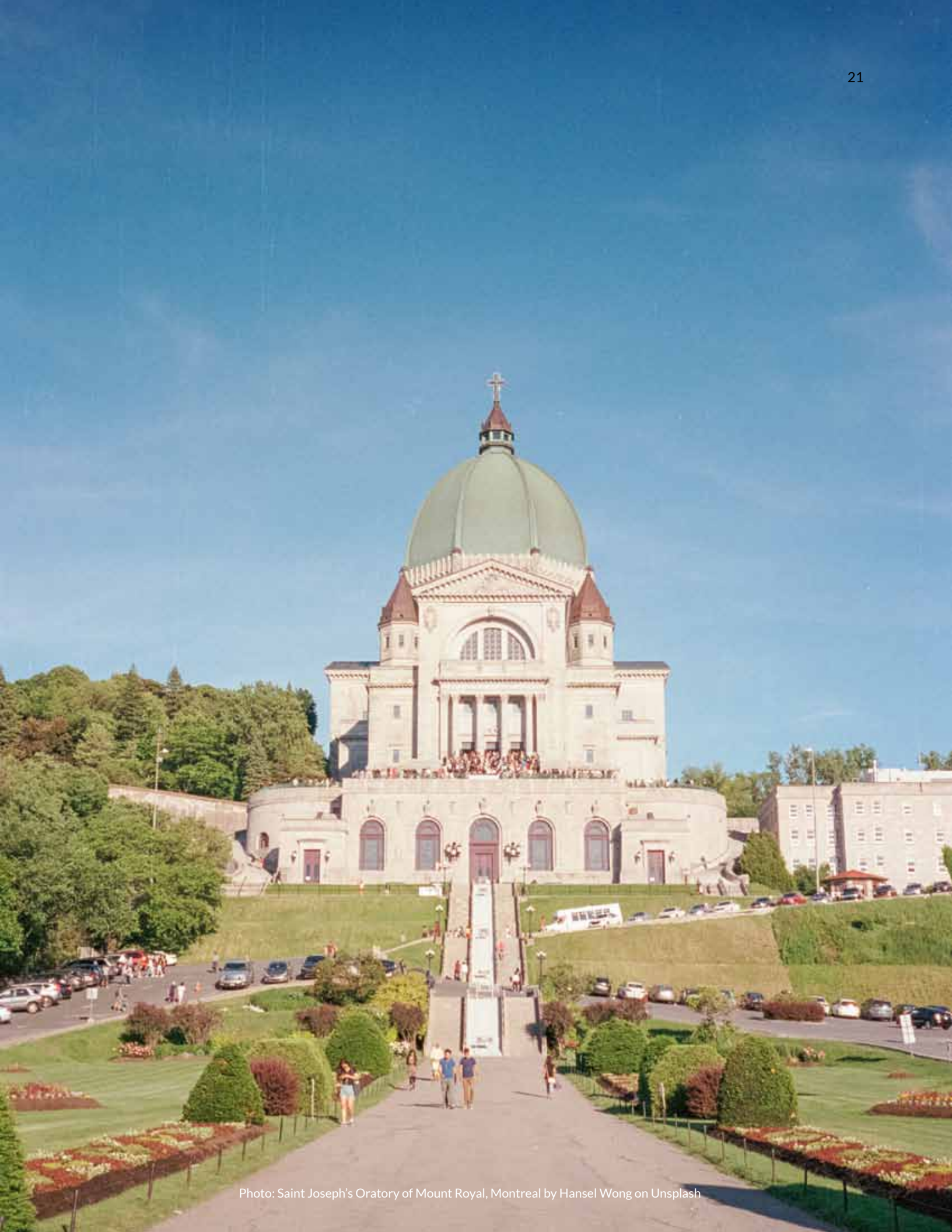
Photo: Saint Joseph's Oratory of Mount Royal, Montreal by Hansel Wong on Unsplash